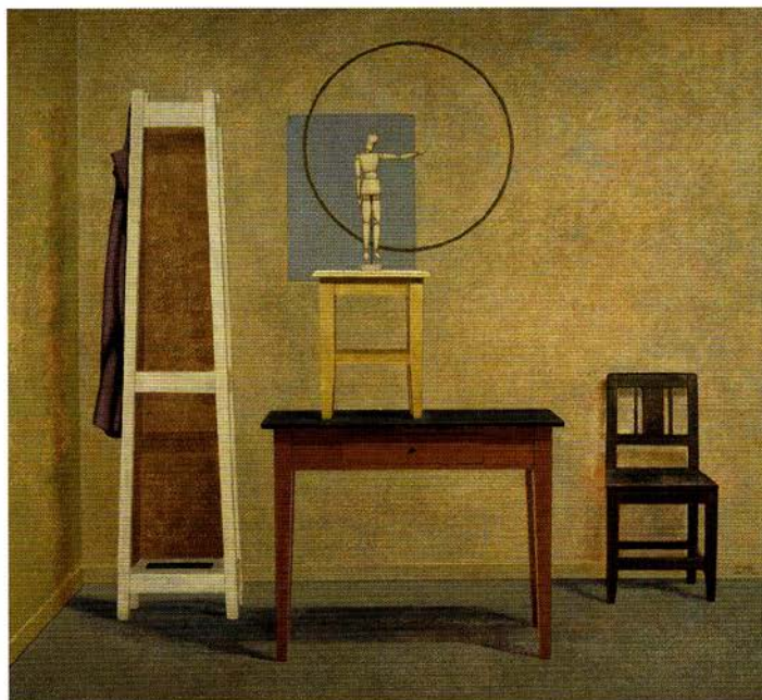
Ida Lorentzen: «Læresetning», 1985.

Hvorfor heter novellen «Rødme»? Tittelen fungerer ofte som et frampek, et hint om hva som vil skje mot slutten. Når hovedpersonen rødmer, nærmer vi oss det punktet der han rører ved jenta han er forelsket i. Dette øyeblikket får mest plass i teksten, for her opplever hovedpersonen noe som han aldri kan glemme.