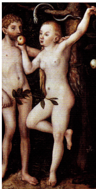
Lucas Cranach: «Adam og Eva», 1533.

Nærlese: lese grundig for å forstå alt som står i en tekst