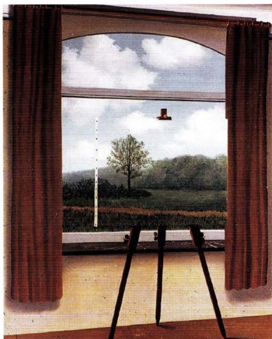
René Magritte: «La condition humaine», 1933.

► Av og til kan du se, høre eller lese noe som viser seg å bety noe annet enn du først trodde.