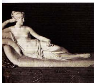
▲ Statuen av Venus er lagd i marmor

En sammenlikning er et språklig bilde der vi bruker ordet «som», «lik», «større enn», «mindre enn» eller «-aktig» for å vise likheter. I «Rødme» står det for eksempel at Gun-Eva har «marmoraktige jentekinn». Men hvis du ikke aner hva marmor er, blir denne sammenlikningen vanskelig å forstå. Marmor er en stein som er glatt og hvit når den blir slipt. Med bildet «marmoraktig» blir Gun-Eva sammenliknet med en vakker, glatt og hvit skulptur.